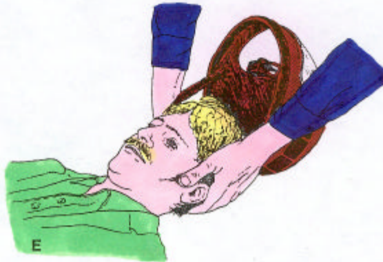
Helmet clears, head lowered onto appropriate back board.