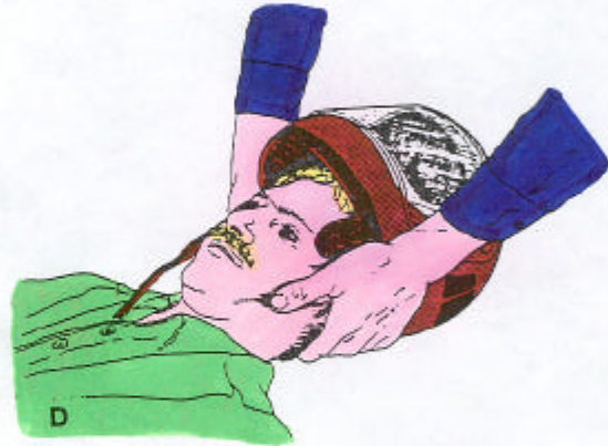
Hands push off helmet while maintaining traction on head.