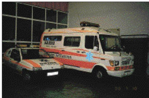
Figura 15. Ambulancia medicalizada del Servicio de Asistencia Médica de Urgencia S.A. (SAMU) de Sevilla (1985).

A continuación se detallan algunas características propias de los sistemas en cada Comunidad, que no han sido descritos en las tablas IV a VI.